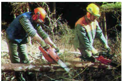
Mauvaise position Bonne position Mauvaise position Bonne position

A chaud : bras tendus, bloquer la poignée entre les jambes