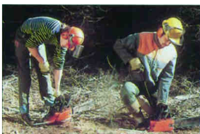
Mauvaise position Bonne position

En protégeant les parties du corps les plus fragiles (articulations et colonnes vertébrales), vous éviterez, après plusieurs années de fatigue d'efforts, que des dégâts apparaissent de façon irréparables et accompagnés de douleurs.